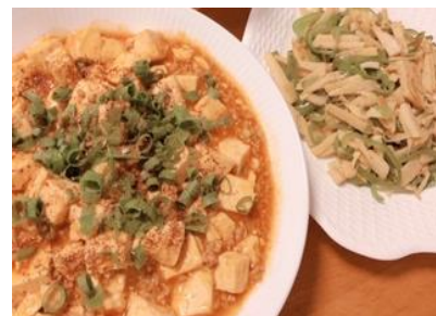
麻婆豆腐と中華風野菜炒め。麻婆豆腐の素を使わず、少し本格的に仕上げてみた。

各自勉強などをしつつ、個性の感じられる生活をしていたようである。来月以降、少しでも元通りの生活に戻れるようお願いしたい。