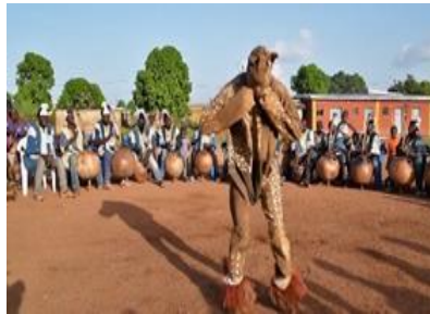
Boloye dance in the north

Our official language is French, but through the country, we have more than 60 ethnic languages with their own culture. So, in the north you could see the ceremony of transition to adulthood with the boloye dance, in the west, beautiful waterfall of Man, in the center, the basilica "our lady of peace" which is the largest church in the world and the beautiful beaches of the south which open onto the Atlantic Ocean.