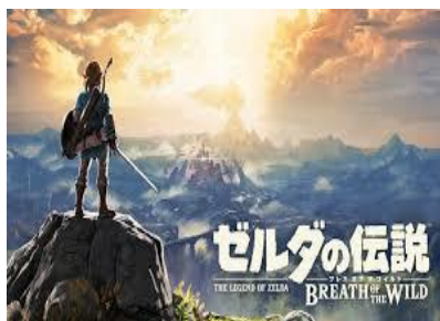
竹本(M1)おすすめの作品。

今月の食品ニュース担当である私ですが、この夏に大学院入試があるため、その勉強をしたり、論文を読んだりしました。また、自宅待機で時間があつたので時々料理に挑戦しました。実家暮らしなので普段はあまり料理をする機会がないのですが、料理は好きなので楽しかったです！