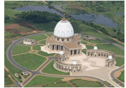
Basilica "Our lady of peace" total area of 30,000 square meters

And if after all that, you feel hungry, do not worry, we got what you need. You can eat fried chicken, mutton, fish, or roast lamb, fried potato, cassava, bean, and yam. Among all the meal, my favorite is "allico". It is made with fried plantain and can be eaten with fried fish, roast chicken, or boiled egg.