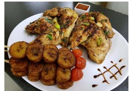
Allico with roast chicken

And if after all that, you feel hungry, do not worry, we got what you need. You can eat fried chicken, mutton, fish, or roast lamb, fried potato, cassava, bean, and yam. Among all the meal, my favorite is "allico". It is made with fried plantain and can be eaten with fried fish, roast chicken, or boiled egg.