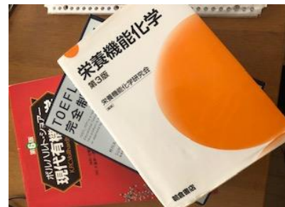
中村(B4)のある日の勉強用教材。